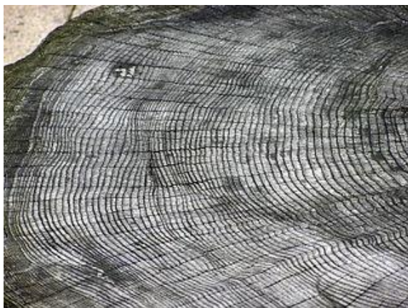
年輪 ウィキペディア「年輪」より