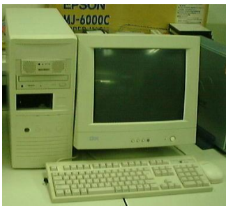
・組み立てパソコン