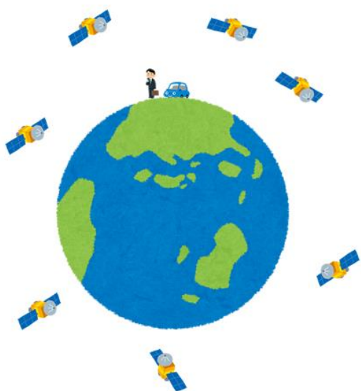
地球の周りには衛星がたくさん回っている