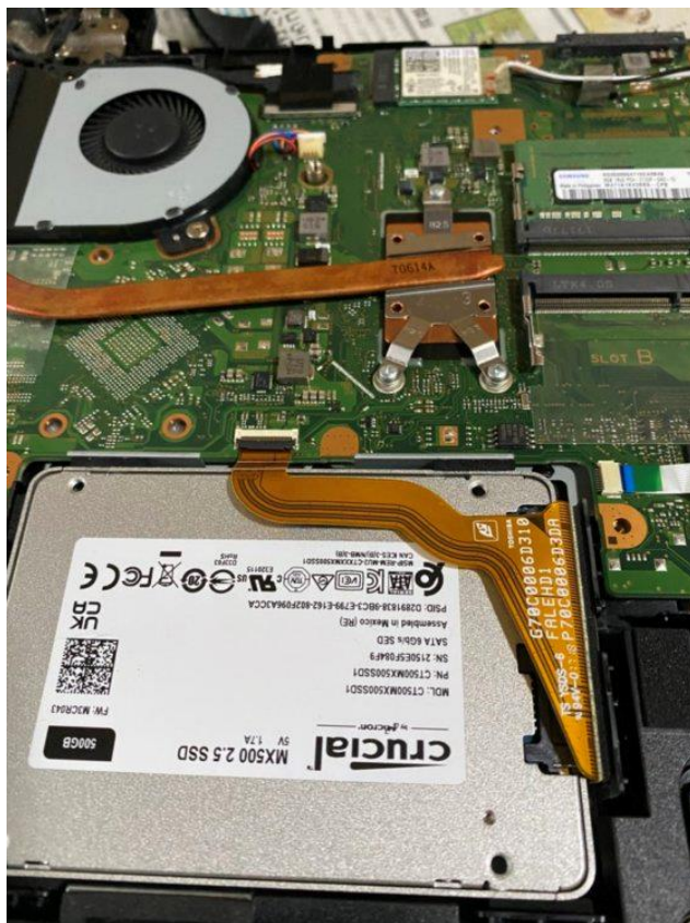
写真 2 枚目は 500GB の SSD を取り付けたところ。3 枚目は SSD と同じサイズのスペースですが、M.2 規格の SSD を取り付けたところです。メモリーのように小さく見えます。